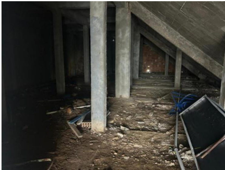
FOTO 9: INSTALAÇÃO DA SECRETARIA DE ESPORTES / APROVEITAMENTO DE LAYOUT.