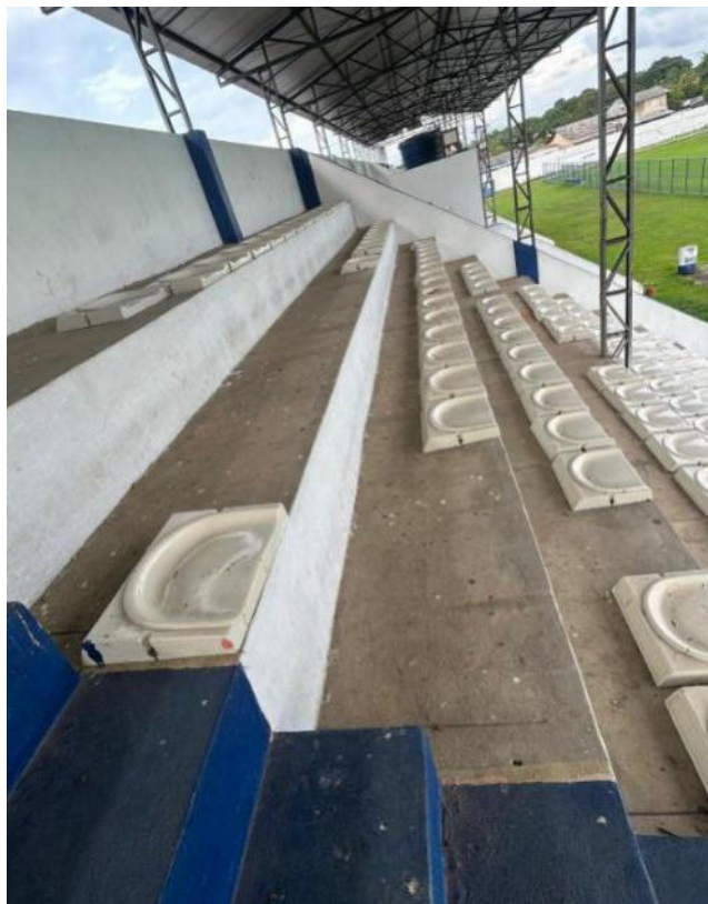
FOTO 5: FORNECIMENTO E INSTALAÇÃO DE ASSENTOS PADRÃO PARA ESTÁDIOS